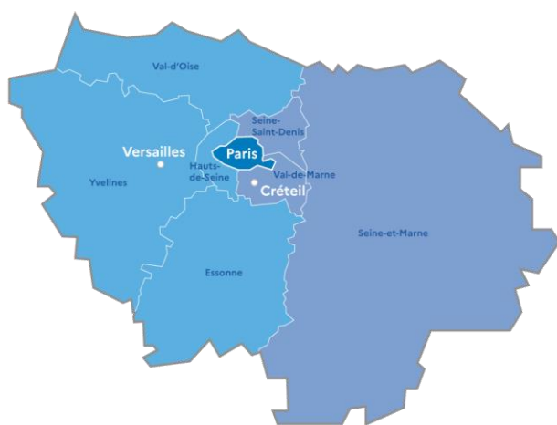
Carte : La région académique d'Île-de-France | Académie de Paris. www.ac-paris.fr/RAIDF