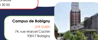
Campus de Bobigny UFR SMBH 74, rue Marcel Cachin 93017 Bobigny