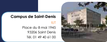
Campus de Saint-Denis IUT Place du 8 mai 1945 93206 Saint Denis tél. 01 49 40 61 00