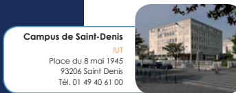
Campus de Saint-Denis IUT Place du 8 mai 1945 93206 Saint Denis Tél. 01 49 40 61 00