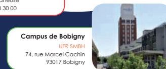
Campus de Bobigny UFR SMBH 74, rue Marcel Cachin 93017 Bobigny